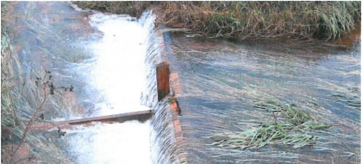
Så rent kan vandet blive, når det forlader en okkersø.

Når der er lavet et indgreb mod okkerforureningen, hvad enten vandspejlet er hævet eller der