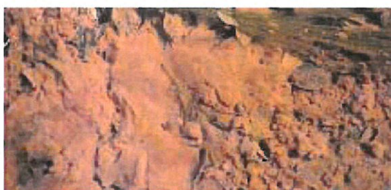
Her er det usynlige jern iltet til rød okker.

Eller vi kan nøjes med at behandle symptomerne. Jernet kan iltes i okkerrensning, der er damme fyldt med planter.