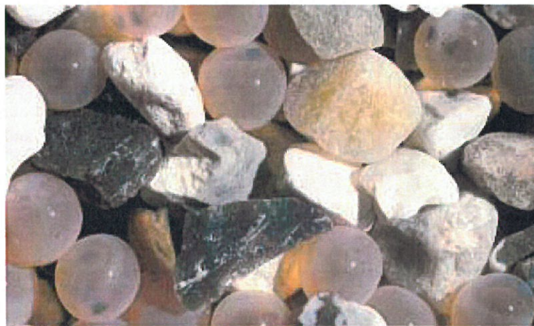
Ørredernes æg ødelægges af okker.

Æggene er i åen på den tid, hvor der er mest ilt i vandet. For at æggene skal overleve, må der hele tiden sive frisk vand med ilt ned til dem. Men okkeren kan lukke de fine porer i gruset, som vandet skal løbe igennem. Så dør æggene.