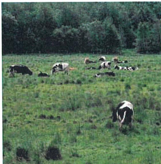
Om sommeren græsser kvierne på engen.

Vintersøer er et skridt på vejen til at løse okkerproblemet på naturens egen måde. Med vintersøerne bliver engene igen det naturlige okkerrens anlæg, de har været i årtusinder. Oprindeligt gik åen hver vinter over sine bredder. Her aflejrede den sand og jord med næringsstoffer, som skabte engen og holdt den frugtbar. Også okker blev aflejret her. Det stoppede, da vi regulerede åen. Vintersøer er et gammelt naturfænomen, vi nu udnytter igen.