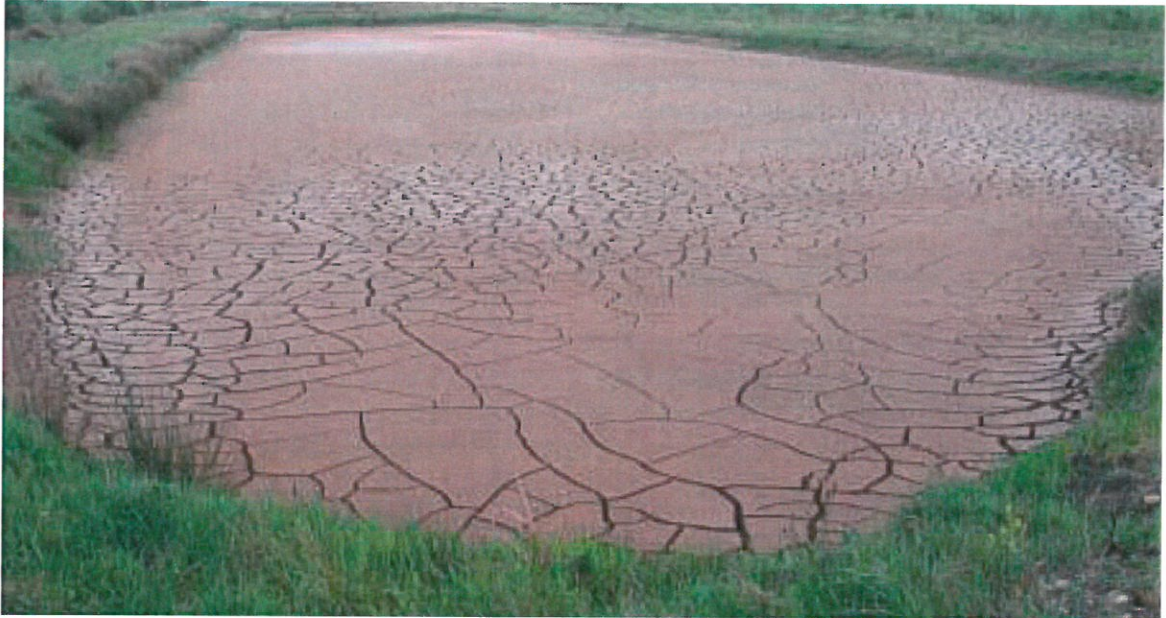
Okkeren ligger tilbage i søen, klar til at blive gravet op.

Der bør plantes buske på vestsiden af søen for at give læ, så blæsten ikke hvirvler for meget okker op. De giver også ly for fugle og vildt. Men der må ikke være så tæt en vækst af træer og buske, at planterne i søen ikke får lys nok.