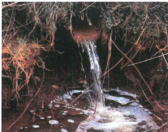
Vandet ser rent og klart ud, men det kan være surt og indeholde giftigt jern.

Når det sure vand neutraliseres og fortyndes på vej gennem engjorden og vandløbet, sker der noget med det giftige, opløste jern. Det forbinder sig med ilt opløst i vandet og bliver til den røde okker. Ved overgangen mellem de to slags jern bliver vandet blakket, og der kan komme noget, der ligner en tynd oliehinde på overfladen. Den røde okker er ikke giftig, men kan skade på anden vis.