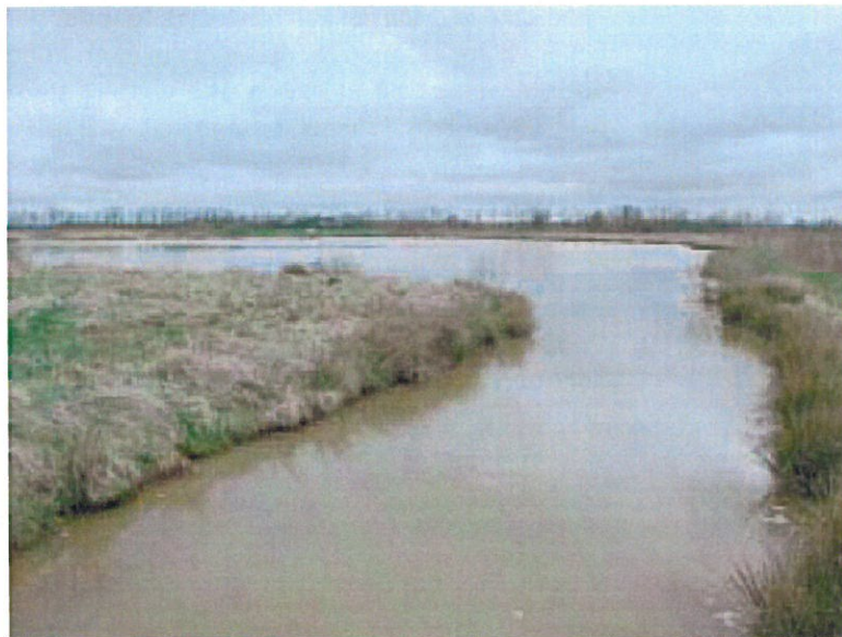
I okkersøen iltes det opløste jern på planter, og okkeren bundfælder.

For at det opløste jern kan iltes, må der være mange vandplanter i søen. De skal kunne tåle okker, og de skal have en stor overflade, det vil sige mange blade. Når det jernholdige vand rører ved vandplanterne, iltes jernet til okker. Her, ganske tæt på planterne, er der nemlig ilt, og det sure vand neutraliseres. Desuden filtrerer planterne den udfældede okker fra vandet, så den ikke skyller med ud. Der skal være planter over hele søen, og det er meget vigtigt at vandet fordeles jævnt og ikke tager en genvej i strømrender mellem planterne. Eventuelt kan okkersøen følges af et dybere udløbsbassin, hvor okker, der er dannet i søen, aflejres.