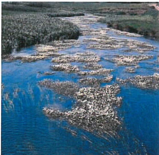
At stoppe grødeskæring er en god og billig vej til at hæve vandstanden. Og der kommer gode levesteder for fisk og smådyr.

En nærliggende løsning er, at åens vandstand hæves ved, at åmanden skæres mindre grøde i åen eller helt stopper grødeskæringen. Så løber vandet i åen langsommere af sted, og vandspejlet stiger. At stoppe grødeskæringen er den mest enkle