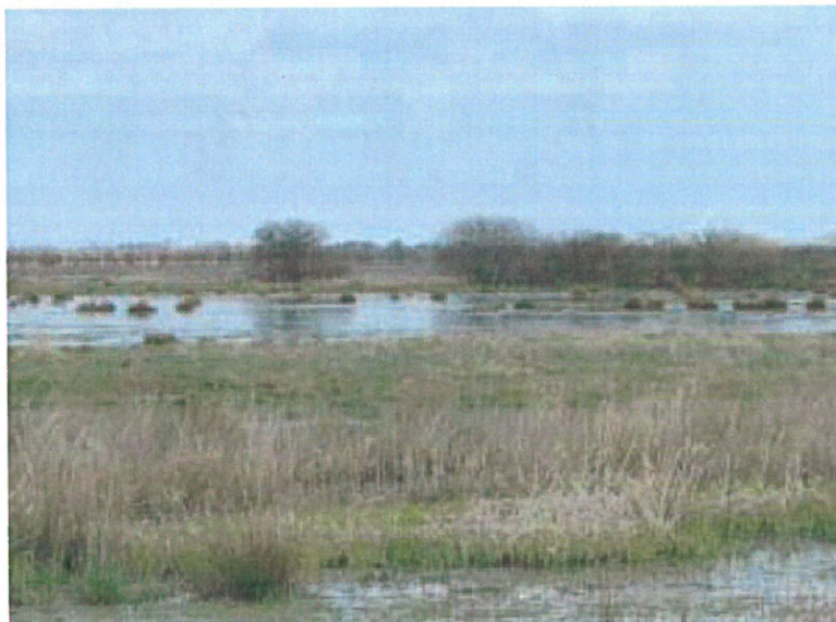
Om vinteren er engen en okkersø.