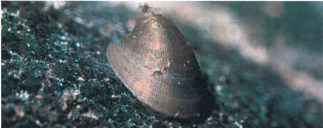
Huesneglen kommer, når okkeren er væk.

er lavet et renseanlæg, er det vigtigt at se efter, om indsatsen lønner sig.