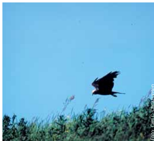
„Står“ en rørhøg eller hedeheg i luften over dig, er det tegn på, at du er for tæt på. Den prøver at fortælle, at æg eller unger kræver ro.

Områdets byggestil er også frisk på virket.