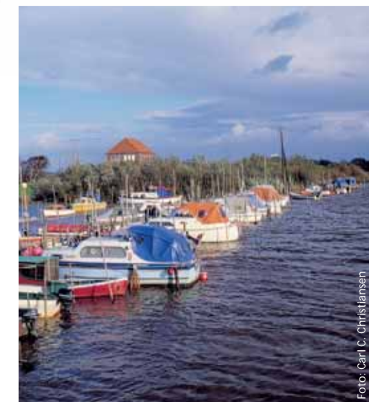
Bådhavn ved Lægan