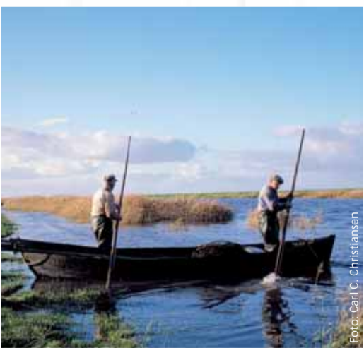
Ålefiskere ved Rudbøl Sø

Et besøg i Rudbøl kan bruges til en gåtur på ådiget, hvor der er en fin udsigt over Rudbøl Sø med dens fugleliv.