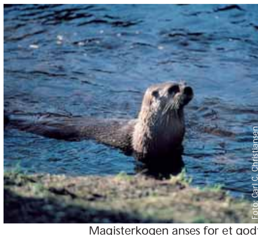
Magisterkogen anses for et godt levested for odderen

Du skal sejle midt på Vidaens løb og det er ikke tilladt at sejle ind i de mange vige med deres rørskove og åkandebælter. Undgå at ligge stille så du ikke hindrer fuglene i at komme til og fra deres reder.